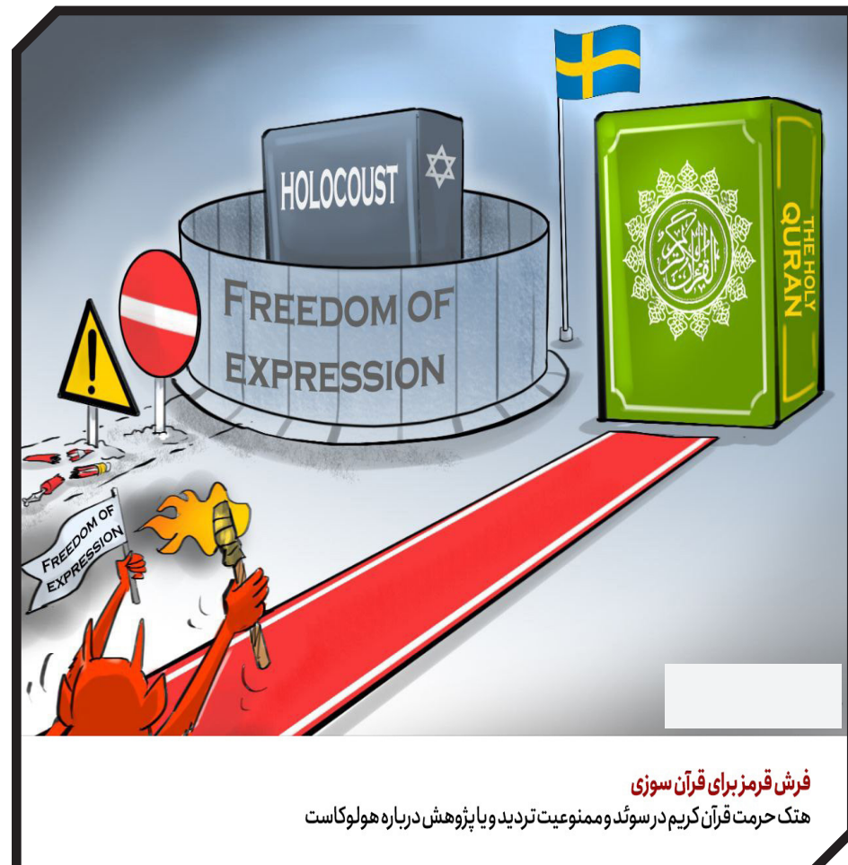
فرش قرمز برای قرآن سوزی هتک حرمت قرآن کریم در سوئد و ممنوعیت تردید و با پژوهش درباره هولوکاست